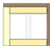
• trapon 2 faces coffrantes